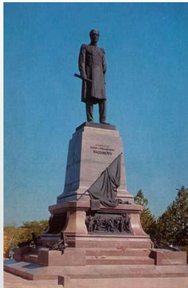
Памятник 1959 г. Скульптор Томский