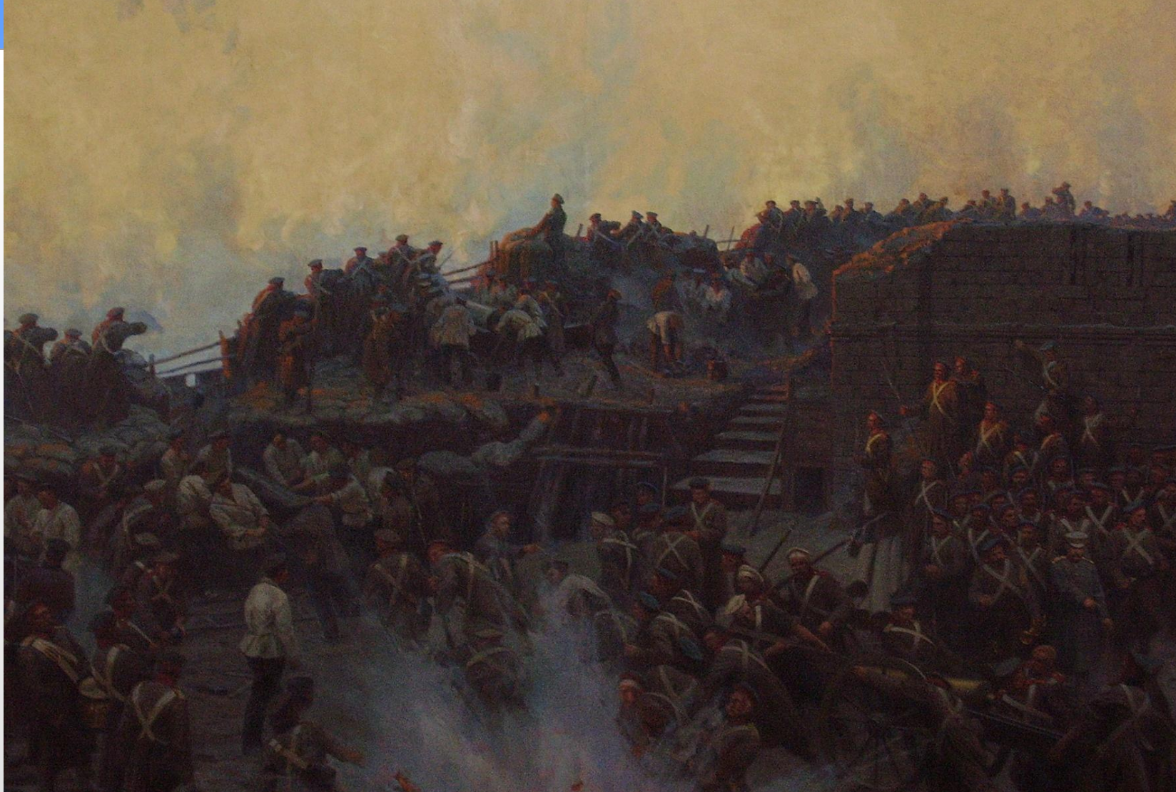
Нахимов в центре. Панорама воспроизводит бой на Малаховом кургане 6 июня 1855г.: 75 тыс. русская армия отразила 173 тыс. англо-французское войско