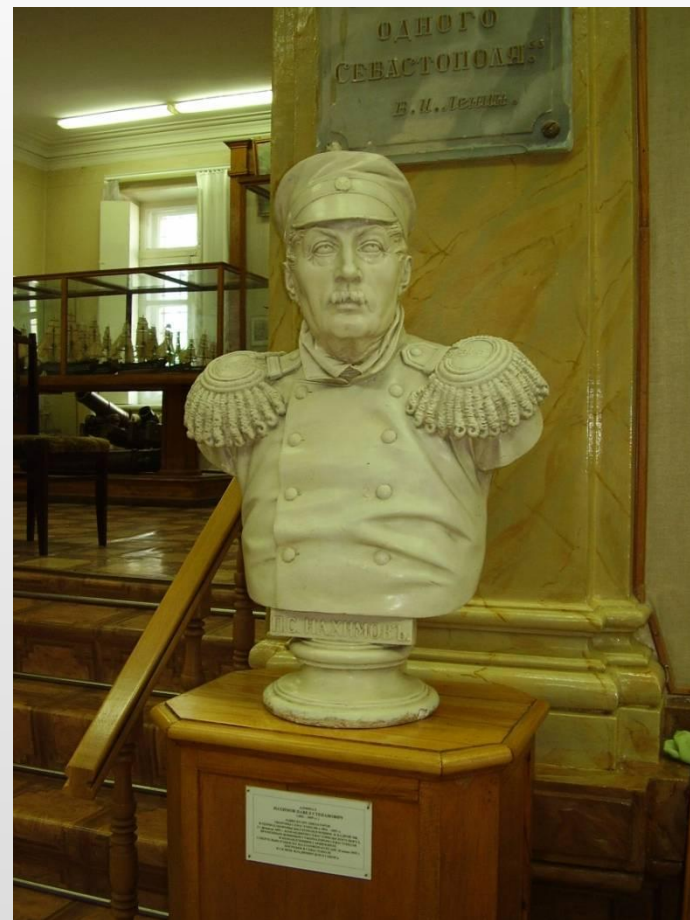
Бюст Нахимова в музее

Этим флагом был накрыт гроб П.С. Нахимова в день похорон 30 июня 1855 года