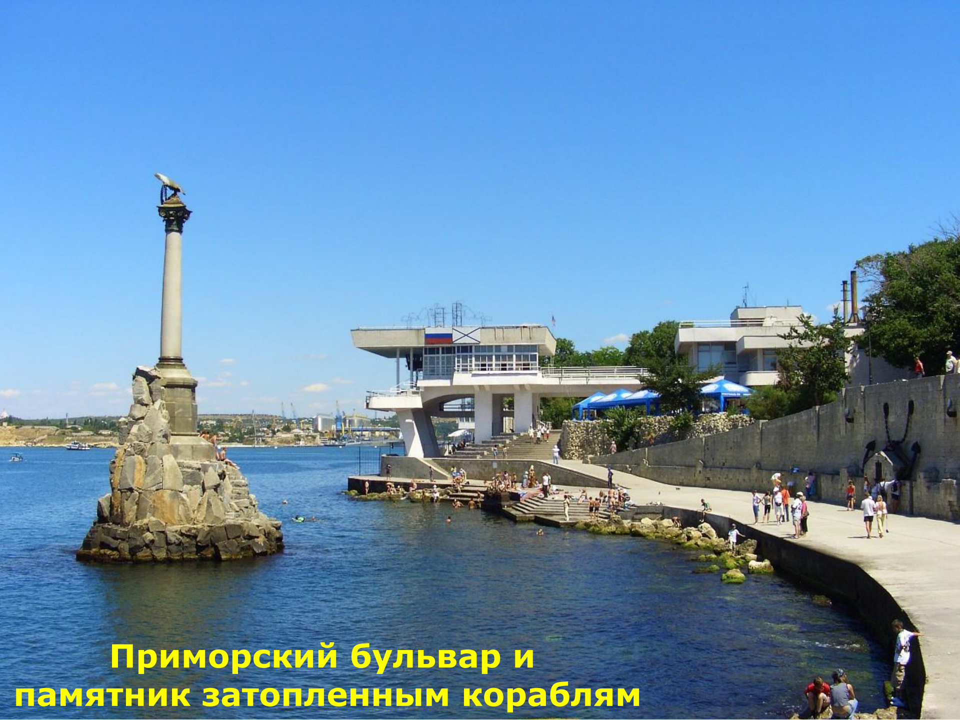
Приморский бульвар и памятник затопленным кораблям