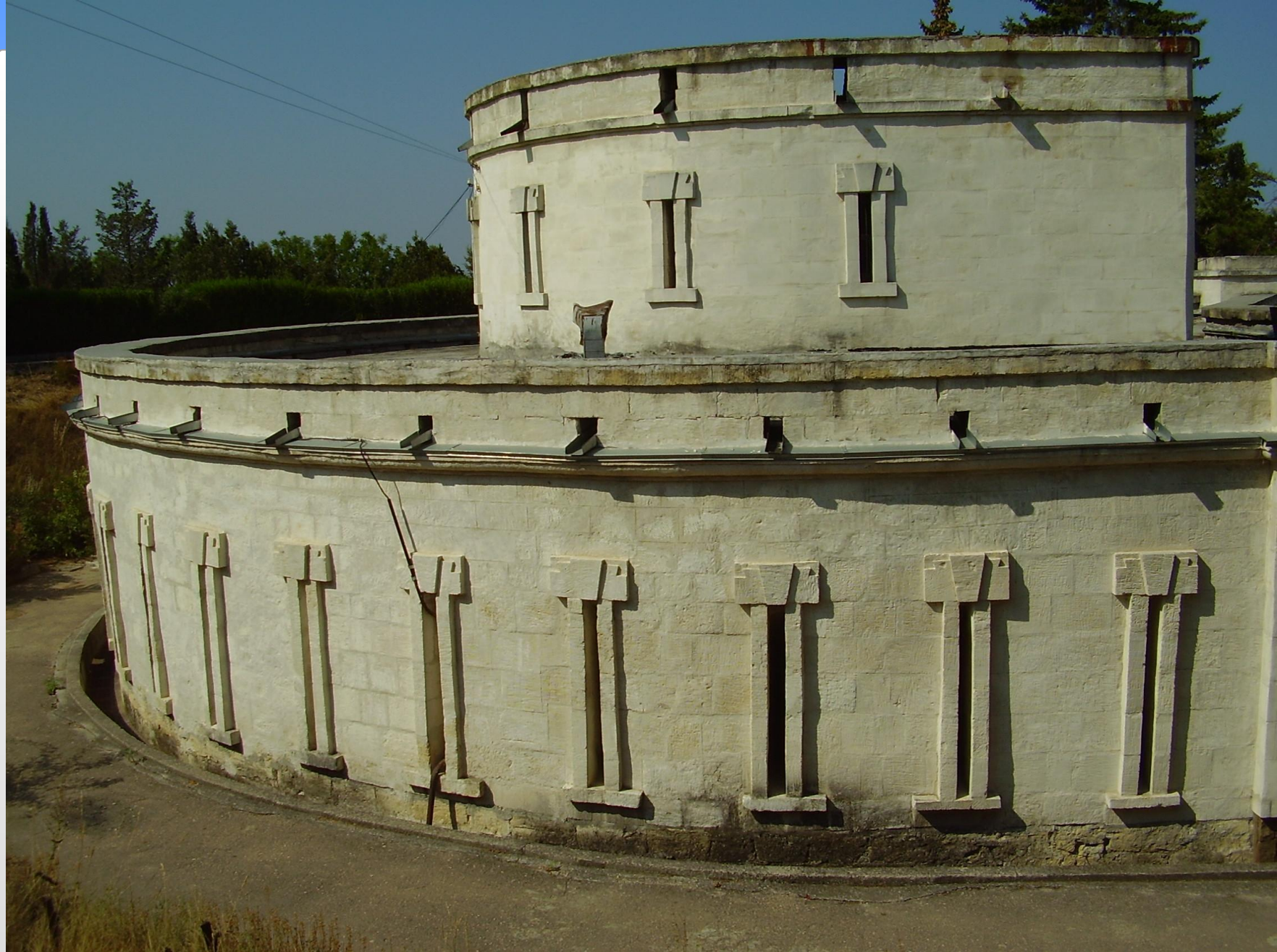
Оборонительная башня (Корниловская) на Малаховом кургане